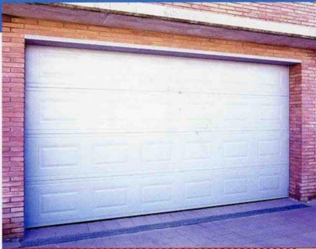
Porta seccional automàtica amb comandaments a distància. Panell de doble xapa lacada blanca amb poliuretà expandidit a l'interior, tipus semirich. Acabat modular a quarterons.