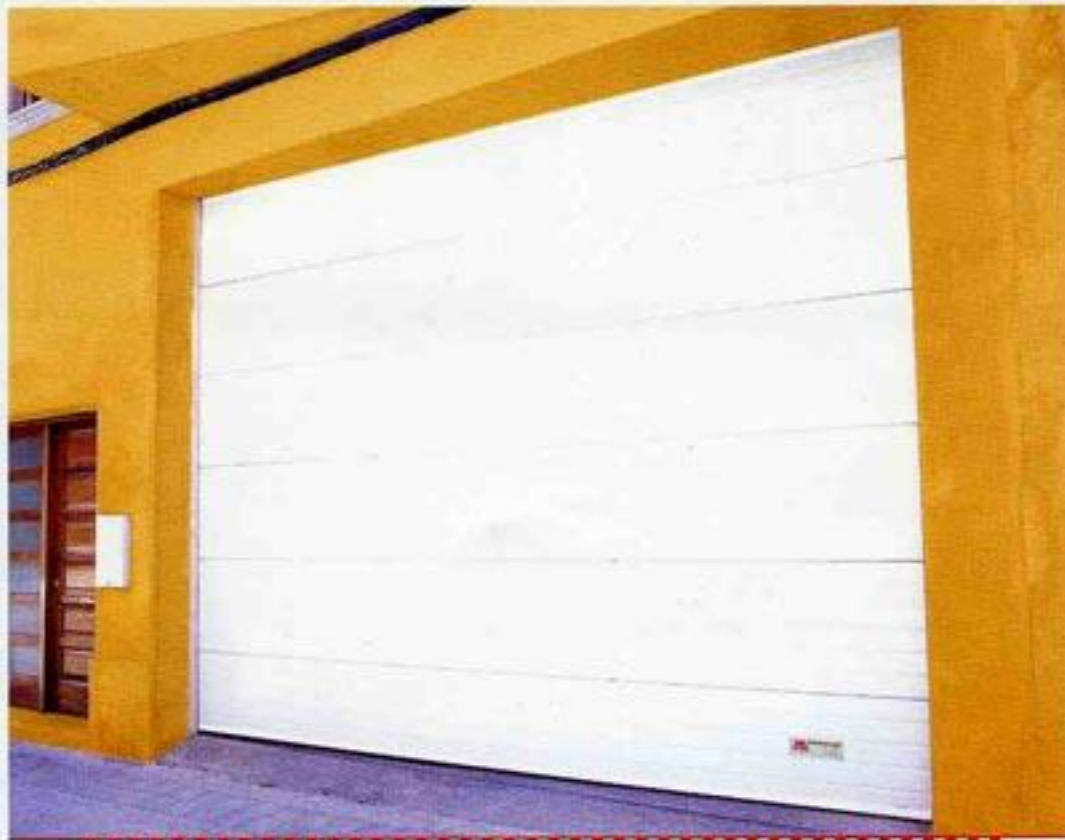
Porta seccional automàtica de doble xapa lacada blanca amb poliuretà expandidit a l'interior, tipus sandvitx. Amb comandaments a distància i encesa automàtica dels llums del garatge. Acabat rotllot horitzontal.